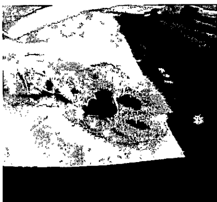
Drenaje de absceso en paciente felino.