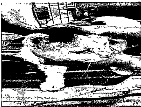
Paciente felina con excelente evolución en control 2 meses después de su pinectomía en ambas orejas + tratamiento con tópico con imiquimod.