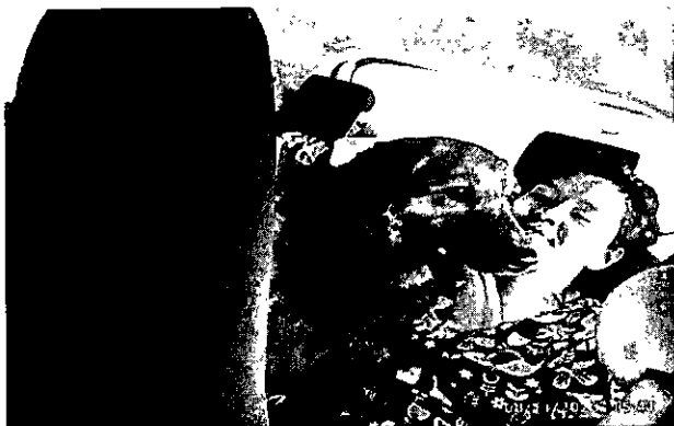
Trasladando a Nube, perrita residente de DIMAO, a su ecografía abdominal